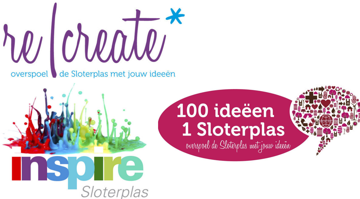
Figuur 3 Mogelijke logo's

Communicatie richt zich op bewoners van Nieuw West, maar ook op andere Amsterdammers of zelfs geïnteresseerden van buiten Amsterdam, maar ook op ondernemers en projectontwikkelaars. Bij de uitwerking van dit plan van aanpak worden de doelgroepen nader gedefinieerd, als mede de strategie om hen te bereiken.. Er zal vooral breed gecommuniceerd moeten worden.