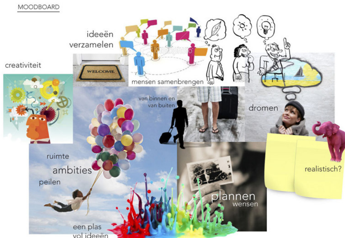
Figuur 2 Moodboard

De Sloterpasconferentie is een eenmalige activiteit. Daarom is ervoor gekozen dat de communicatie een campagneachtig karakter zal hebben. De communicatie moet geïnteresseerden een handelingsperspectief bieden. We willen daarbij het Sloterpasgevoel communiceren. Onderstaand moodboard (figuur 2) en de mogelijke logo's (figuur 3) geven daarvoor een voorzet. De slogan 'overspoel de Sloterpas met jouw ideeën' verwoordt in een notendop waar we op uit zijn. We willen mensen uitdagen met ideeën te komen, rijp en groen, om te realiseren in het Sloterpasgebied. Ideeën mogen divers en zelfs tegenstrijdig zijn. Het gaat om een palet van mogelijkheden en kansen voor de Sloterpas.